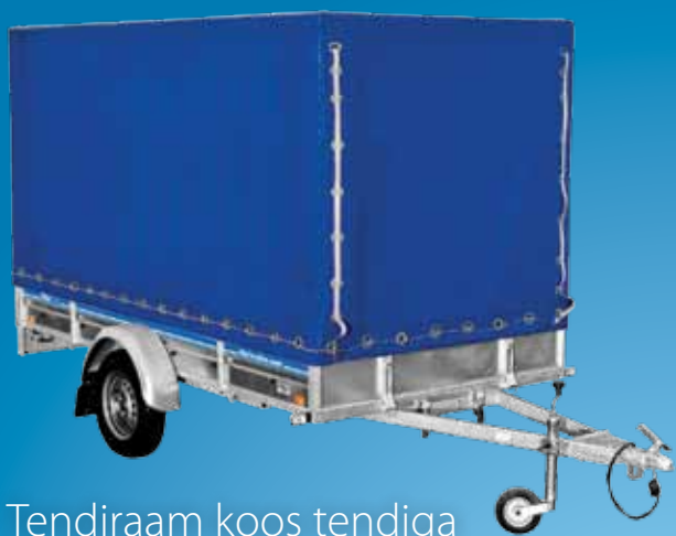
Tendraam koos tendiga